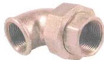
BOCCHETTONE CURVO SEDE CONICA F/F - ISO UA11