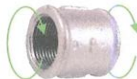
MANICOTTO DESTRO - SINISTRO F/F ISO M2 R-L