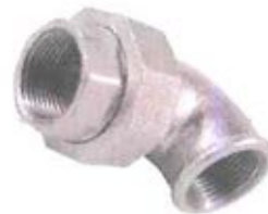
BOCCHETTONE CURVO SEDE PIANA F/F ISO UA1